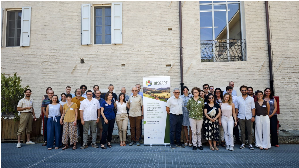
Συνάντηση της κοινοπραξίας GI SMART στην Πάρμα, Ιούλιος 2025

γεωγραφικών ενδείξεων (ΓΕ) στην αειφόρο ανάπτυξη των αγροτικών περιοχών και στους στόχους της στρατηγικής « από το αγρόκτημα στο τραπέζι ». Συντονίζεται από το INRAE και περιλαμβάνει 17 εταιρίες από 10 χώρες, μεταξύ των οποίων πανεπιστήμια, ΜΚΟ και οργανώσεις που δραστηριοποιούνται στον τομέα των ΓΕ.