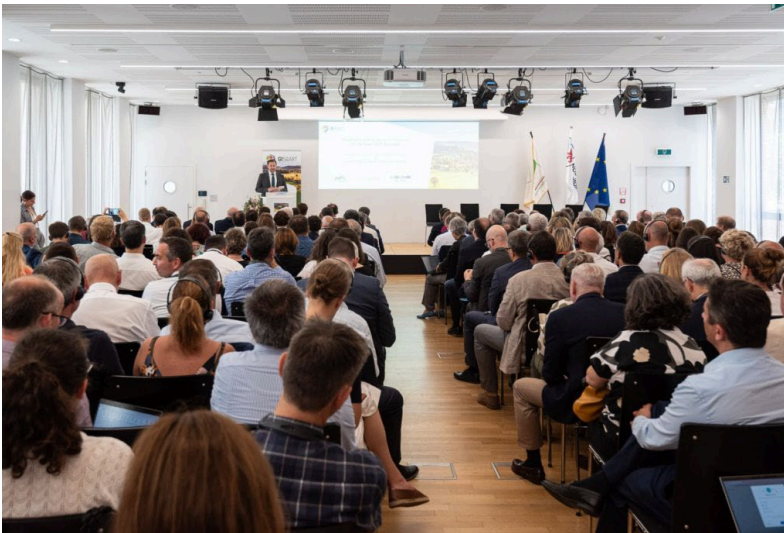
Conférence sur les indications géographiques, Bruxelles, juin 2025

La conférence sur les indications géographiques qui s'est tenue à Bruxelles les 25 et 26 juin 2025 a constitué un moment clé de réflexion collective.