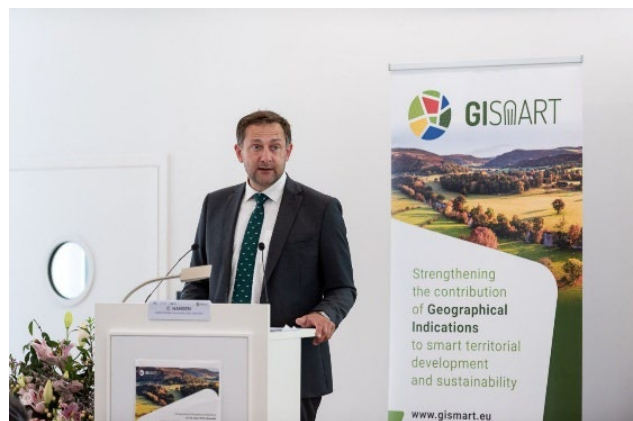
Conférence sur les indications géographiques, Bruxelles, juin 2025 | Commissaire Christophe Hansen